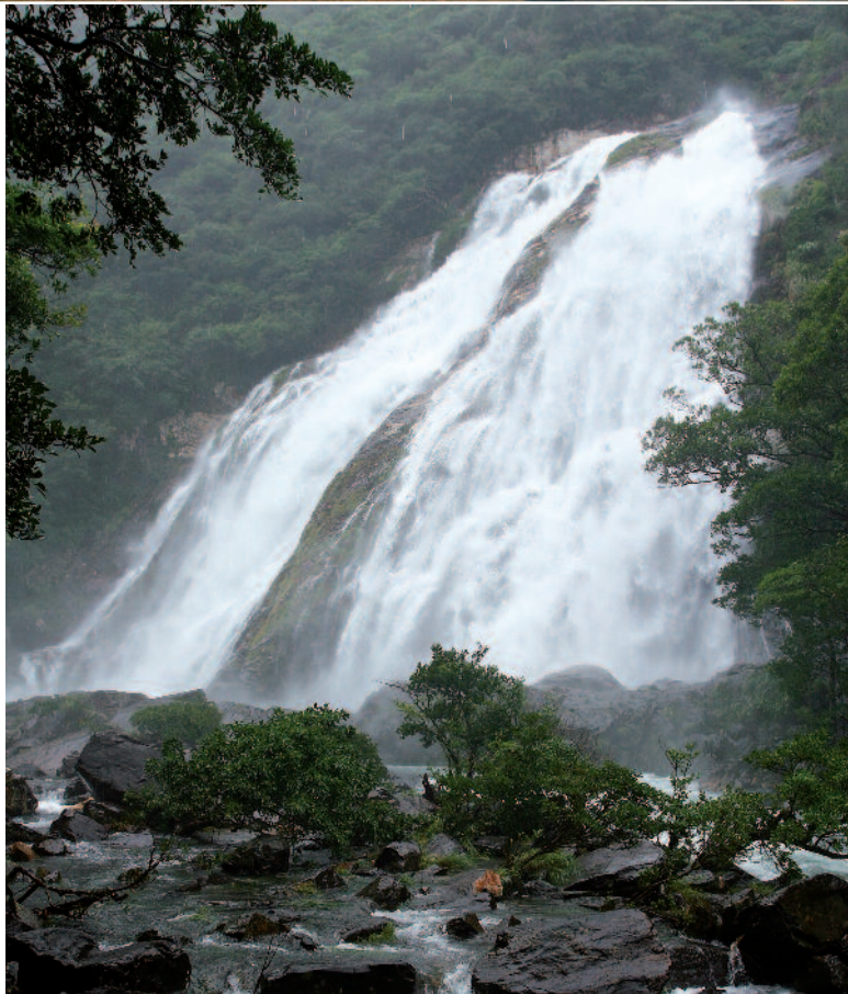
IMAGES OF WATERFALLS IN THE YAKUSHIMA ISLAND. IMMAGINI DI ALCUNE CASCATE ALL'INTERNO DELL'ISOLA DI YAKUSHIMA. Изображения некоторых каскадов на острове Якушима

у себя один крестьянин. Вскоре он был раскрыт, арестован и сослан в Эдо (ныне Токио). Его держали в “доме для христиан”, а потом его допрашивал один из самых влиятельных мыслителей той эпохи, конфуцианский мыслитель Хакусеки Араи, но из-за его прозелитической деятельности его снова отправили в камеру, где он и скончался. Таки образом Сидотти не удалось распространить здесь христианство, но удалось поделиться своими знаниями через книгу “Seiyu Kibun” (Знания о Европе): которую Хакусеки Араи записал сразу после разговора с Сидотти, и в которой Япония открыла для себя один из самых богатых источников европейской науки. Сегодня в том месте, где он высадился, находится католическая церковь, названная в честь Святой Марии, и несколько памятных монументов.