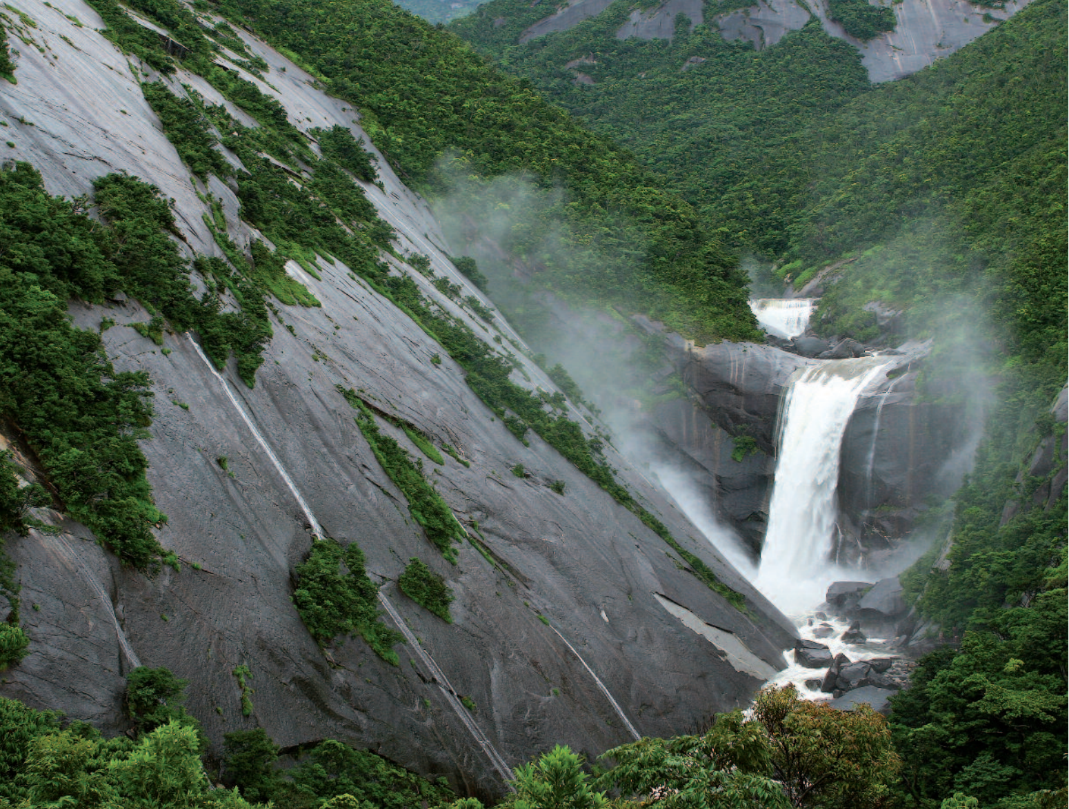
IMAGES OF FLORA AND FAUNA OF THE YAKUSHIMA ISLAND. IMMAGINI DELLA FLORA E FAUNA DELL'ISOLA DI YAKUSHIMA. ИЗОБРАЖЕНИЯ ФЛОРЫ И ФАУНЫ ОСТРОВА ЯКУШИМА.