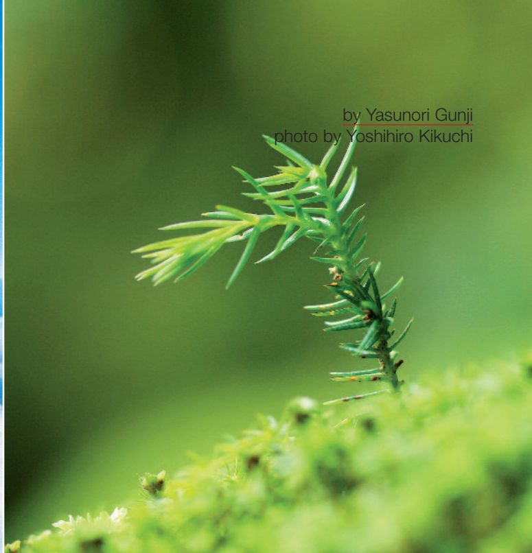
by Yasunori Gunji