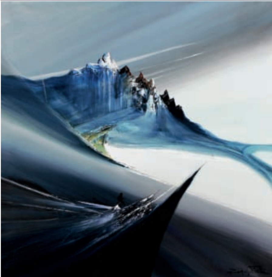
TOP, THE WORK "DALL'ALTO" AND BELOW, "L'APPRODO". IN ALTO, L'OPERA "DALL'ALTO" E IN BASSO, "L'APPRODO". Вверху, работа «Сверху» и внизу «Причал».